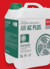
LIMPIADOR ESPUMANTE BASE ÁCIDA PARA CONDENSADORAS (Baterías Condensadoras)