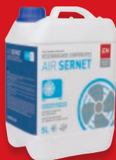
DESENGRASANTE LIMPIADOR COMPONENTES CLIMATIZACIÓN (Baterías Evaporadoras y Condensadoras)