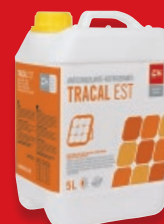
ANTICONGELANTE-REFRIGERANTE CONCENTRADO PARA ENERGÍA SOLAR TÉRMICA