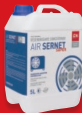
DESENGRASANTE CONCENTRADO LIMPIADOR DE HVAC (Baterías Condensadoras)