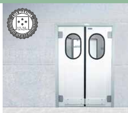
Puertas sobre marco de aluminio para montaje en panel. Leaf mounted on aluminium frame to be assembled on the panel.