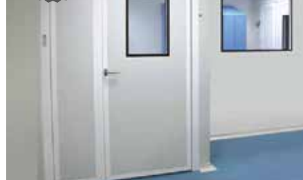
Puertas sobre marco de aluminio para montaje en panel. Leaf mounted on frame to be assembled on the panel.