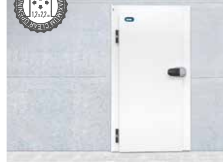
Puertas sobre marco de aluminio para montaje en panel. Leaf mounted on aluminium frame, to be assembled on panel.