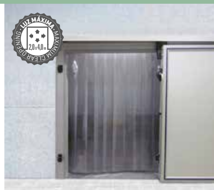
La cortina de lamas está diseñada para separar diferentes áreas minimizando el flujo de aire en las aperturas de las puertas frigoríficas.

The strip curtain is designed to separate different areas, minimising the air flow during door openings.