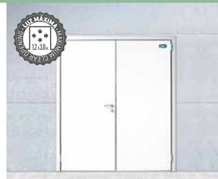
Puertas sobre marco de aluminio para montaje en panel. Leaf mounted on aluminium frame, to be assembled on panel.

Semi-insulated door designed for positive temperature premises, offices and work areas, laboratories, etc., a simple design, hygienic and efficient.