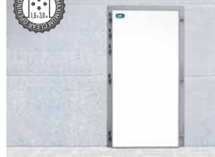
Puertas sobre marco de aluminio para montaje en panel. Leaf mounted on aluminium frame, to be assembled on panel.