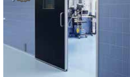
Puerta destinada al sector hospitalario, quirófanos, industria farmacéutica y de microelectrónica. En todos aquellos ambientes en los que el flujo de aire es de vital importancia. Door designed for the hospital sector, operating rooms, pharmaceutical and microelectronic industries. For all those environments in which the air flow is of vital importance.